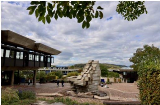
Das Zielgelände der dreitägigen Laufveranstaltung befindet sich auf dem Campus Irchel der Universität Zürich.