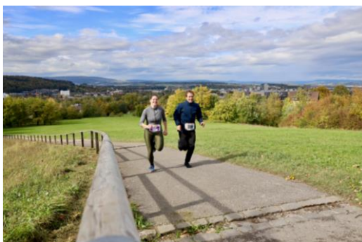
Höhenmeter und Weitsicht: Bei den Kategorien «Volkslauf» und «Run for Fun» geht's auf eine zusätzliche Runde in Richtung Zürichberg-Wald.

Pressebilder zur freien Verwendung: https://www.flickr.com/photos/silvesterlauf/albums/72157716396528937