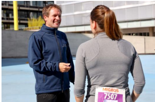
«Aufwand und Risiko, diesen völlig neuen Lauf zu organisieren, sind nicht unerheblich», sagt OK-Präsident Corsin Caluori. Bild: Blauer Platz der Uni Irchel.