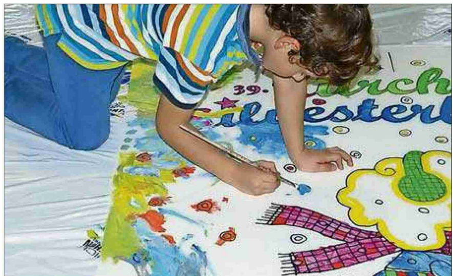
Kinderlachen und Farbgeruch erfüllten die Sporthalle Hardau.